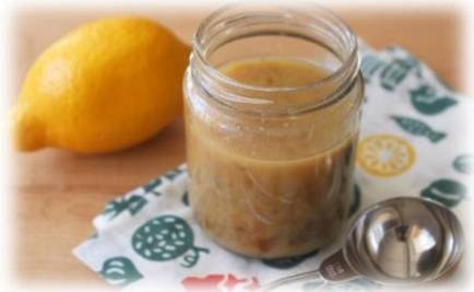
材料(作りやすい分量)

市販のぽん酢は意外と量が多く、使い切るのは大変ですよね。手作りぽん酢は、 使いたい時に使いたい量だけ 作ることができ、お好みのかんきつ類を使ったり、甘さや塩加減を調節することができます。今回は砂糖の代わりに天然の甘味料「甘酒」を使用しました。材料をあれこれ変えて「我が家のぽん酢」を作ってみてください。